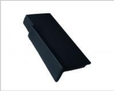
7. 128221579 Harjan aloitus ja lopetustiili Tegalit musta