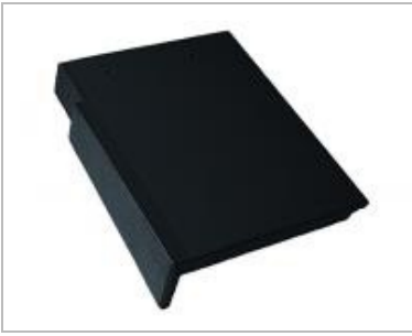
6. 128222879 Tegalit 1/2 vasen päätyreunatiili musta