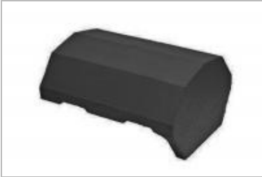
8. 304500499 Aluskate Divoroll Universal +